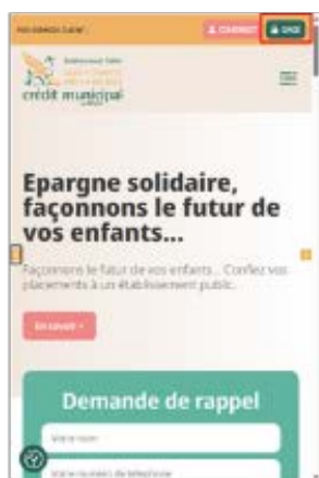
SUR TÉLÉPHONE MOBILE

Rendez-vous sur le site www.credit-municipal-nimes.fr , puis cliquez sur l'onglet "Gage" situé en haut à droite de votre écran, pour accéder à votre espace client